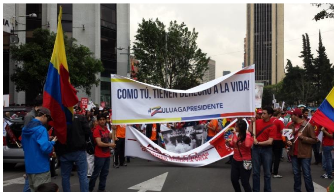
d. Pancartas Óscar Iván Zuluaga, Marcha por la Vida, 2014.

La estrategia política ha estado centrada en el impulso de reformas a la Constitución para retroceder en el derecho a la interrupción voluntaria del embarazo concedido por la Corte Constitucional en 2006. Para tal fin, han adelantado formas de presión ciudadana como la firma de Manifiestos por la Vida con candidatos/as a la Presidencia y a las elecciones locales, mediante la cual invitan a sus seguidores/as a que se “elija a conciencia por aquellos candidatos que estén dispuestos a gobernar por las madres y los niños desde el inicio de su vida” (Aci Prensa, Colombia: 90 mil marchan por la vida y contra el aborto, 19 de mayo de 2014).