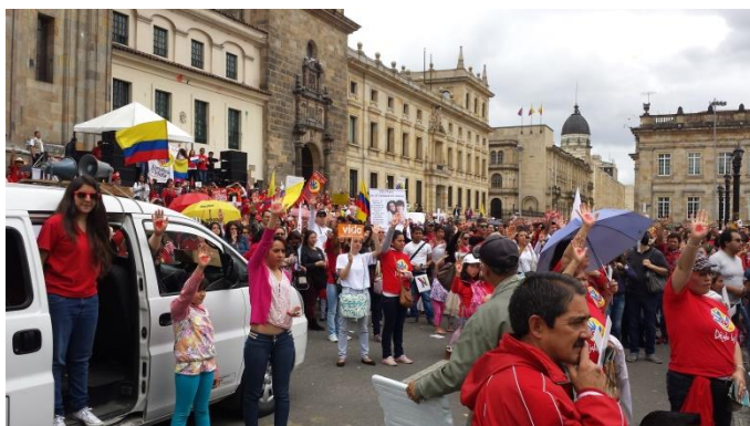
g. Oración durante Marcha por la Vida, 2014.

La religión es un aspecto central en la redes “pro vida”, aunque los discursos hayan iniciado el camino de la secularización para ganar más seguidores/as y entrar a jugar bajo las reglas democráticas. Unidos por la Vida no es la excepción, pese a que esta plataforma actualmente se cataloga como multiconfesional, muchas de sus apuestas se nutren específicamente del cristianismo católico para validar su ideología.