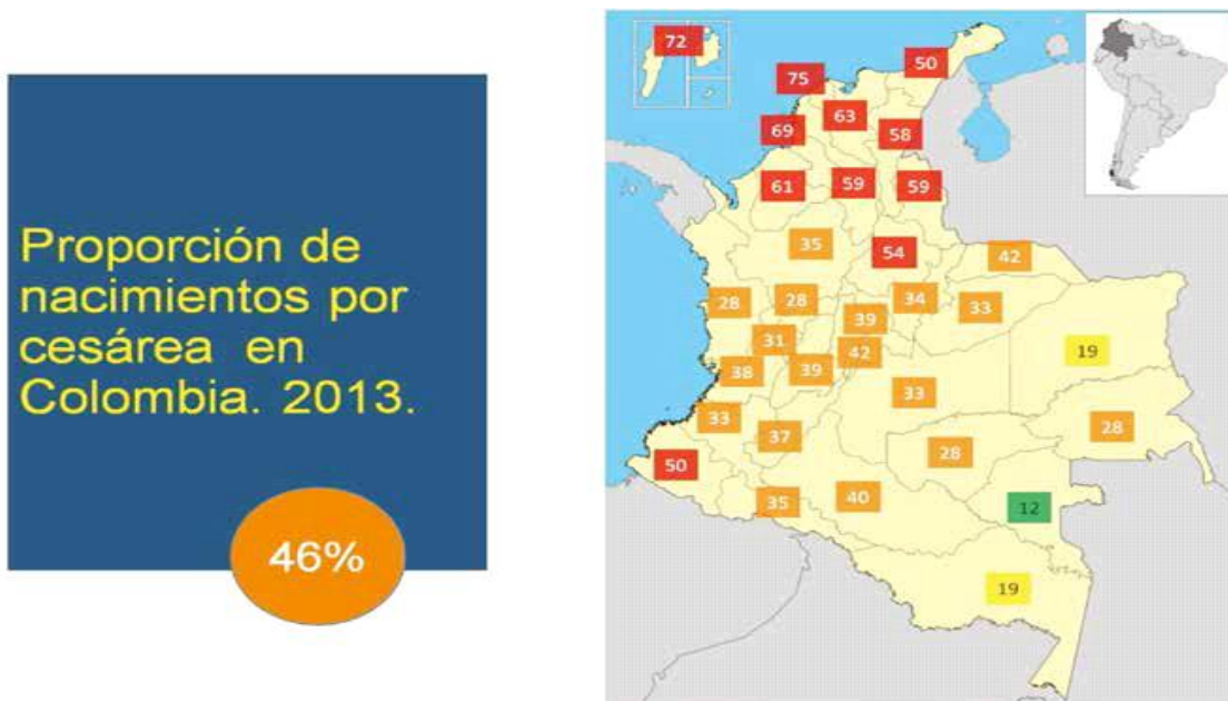
Figura #7: Proporción de cesáreas en Colombia en el 2013.

Solo un día después, el 13 de abril del 2015, el mismo diario publica: “Epidemia de cesáreas”: “Aunque según las recomendaciones de la Organización Mundial de la Salud, sólo entre el 10% y el 15% de los nacimientos debería resolverse con ayuda de este método, hay países como Colombia donde casi la mitad de los partos (el 46% para el 2013) se dan por cesárea y no de forma natural” [Es decir, en Colombia las cifras de cesáreas en algunos departamentos del país sobrepasan a Brasil, líder en “la cultura de la cesárea”]: “El caso de Colombia resulta alarmante para gremios médicos como la Federación Nacional de Obstetricia y Ginecología (FECOLSOG). Mientras en 1998 la tasa de cesáreas del país llegaba a 24,9% hoy uno de cada dos niños nace por cesárea, y en algunas regiones, como en departamentos del Caribe, este porcentaje se dispara a 75%” (El Espectador 13 de abril de 2015).