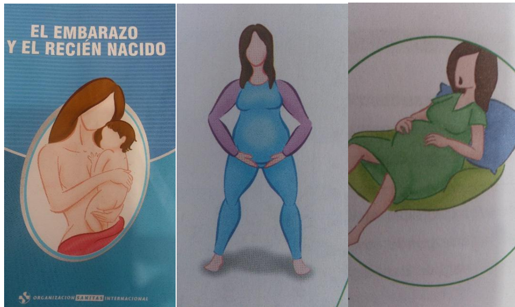
Figura # 1: Imágenes extraídas de: (Organización Sanitas Internacional 2007.) Nótese la ausencia de cara y las prominentes barrigas.

pero con barriga prominente, ataviadas con las clásicas batas hospitalarias o con el torso desnudo y sujetando entre sus brazos a su hijx que lacta. Además de sugerir imágenes de la Virgen María que alza a Jesucristo entre sus brazos, y que nos conecta con la maternidad doliente y sacrificada antes analizada, también nos induce la importancia que para el sistema tiene la eliminación de las diferencias y la individualidad, lo que posibilita la práctica generalizada de intervenciones protocolarias y rutinarias. Así mismo, la eliminación de la cara y la exhibición de vientres prominentes anuncian la visibilidad otorgada a la criatura gestada, en detrimento de la importancia de la dueña del embarazo/parto.