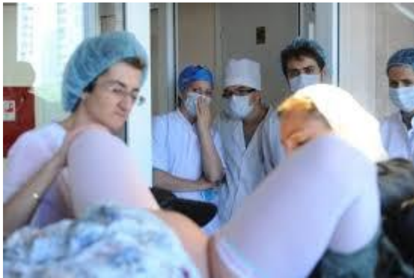
Figura #5: Imagen extraída de: “La violencia obstétrica no existe. O eso quisiera decirte”. Disponible en: http://www.elpartoestuestro.es/blog/2012/11/27/la-violencia-obstetrica-no-existe-o-eso-quisiera-decirte . (Consultado el 24/01/2016)