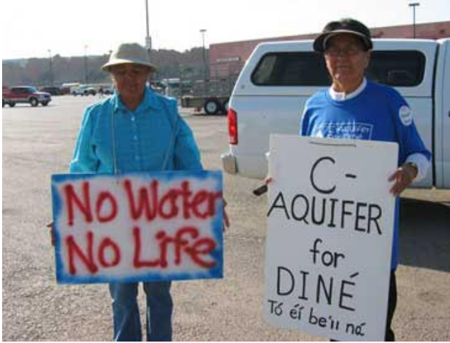
Members of the group C Aquifer for Diné protest the use of Navajo groundwater for coal mining projects.

processes currently operating in the Navajo Nation government, while at the same time stressing the central importance of tribal sovereignty, self-determination, and good governance.