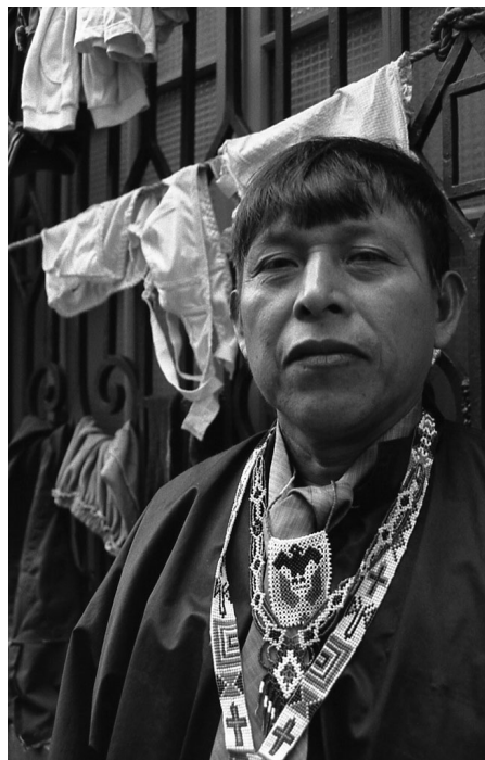
Ilustración 6. Qué es una traza racial