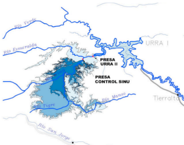
Ilustración 3. Proyecto Río Sinú – Detalle Embalse de Control.

represa no recibe el nombre de Urrá II, ahora se proyecta todo un complejo al que se ha denominado Proyecto Río Sinú y que tendrá dentro del sistema de represas una que se llama Urrá I.