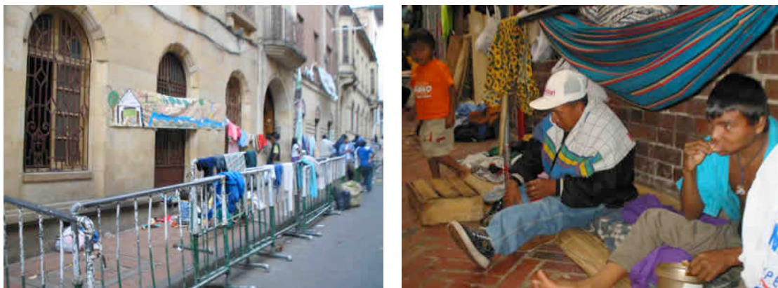
Ilustración 4. Toma a Bogotá 2004 Barricadas dispuestas por la Policía Nacional

cabildos mayores, que vivían en su mayoría en el resguardo no recibían esos dineros porque no habían logrado censarlos debido a los problemas del conflicto armado en la zona.