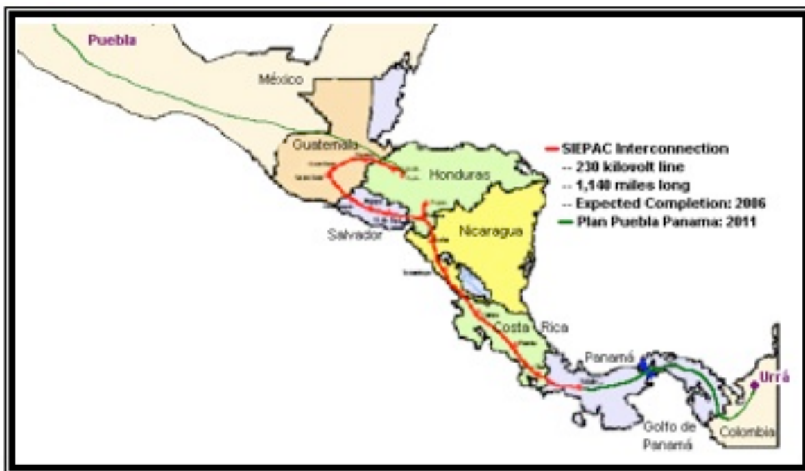
Ilustración 1. Interconexión Eléctrica de los países de América Central. Proyecto inscrito dentro de la Iniciativa Energética mesoamericana. (www.proyectomesoamerica) (Modificado por la autora).

la represa el municipio de Tierralta sigue contando con el precario acueducto de antes de la represa, que únicamente provee agua sin potabilizar una vez a la semana al casco urbano y carece de alcantarillado en gran parte del mismo.