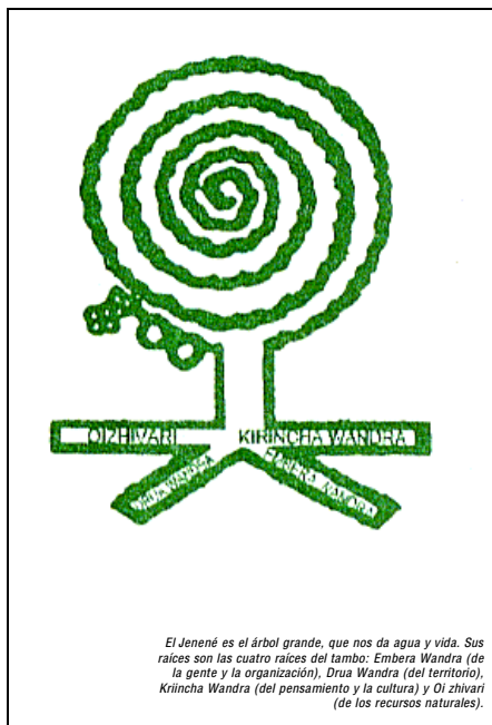
Ilustración 5. El árbol Jenené y sus cuatro raíces