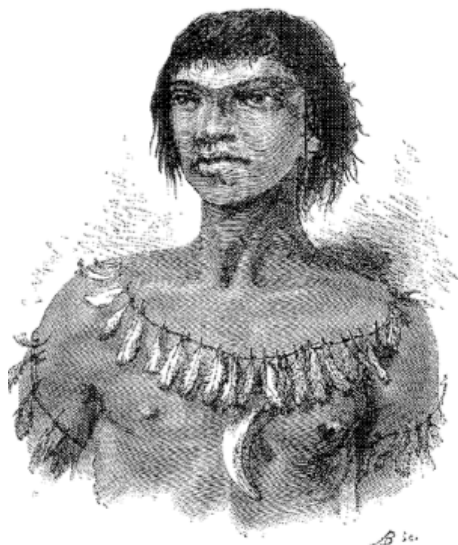
Indio del río Verde

da cuenta de ciertas luchas de dominación, dejando actuar la diferencia como referencia de desigualdad.