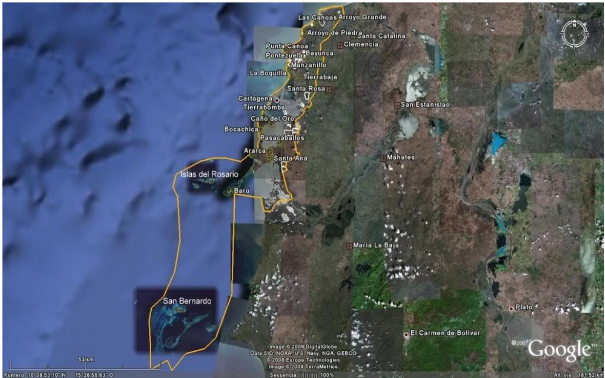
Mapa 1 Corregimientos de Cartagena. Fuente: Google Earth. 2009.