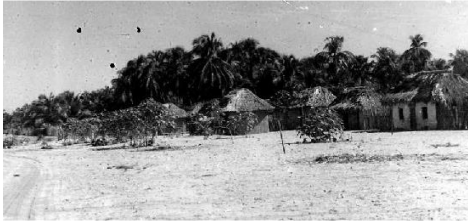
La Boquilla en 1949.

escenarios propicios e ideales para el desarrollo de esta actividad. El boquillero desde niño tiene contacto con este milenario arte, y es que el territorio al estar rodeado por mar y cienagas se torna inevitable no interactuar directa o indirectamente con este oficio. 32