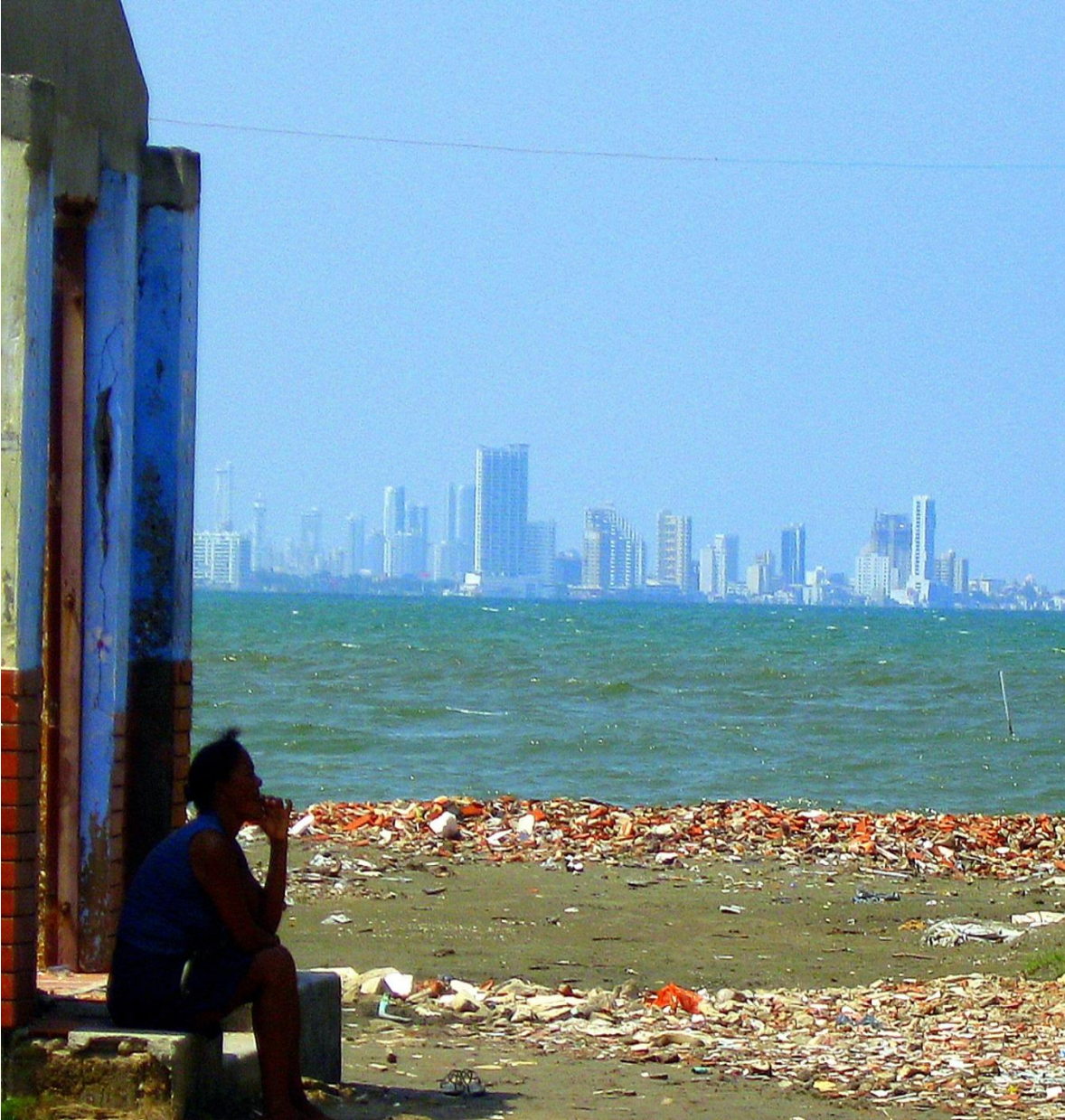
Panorámica de Cartagena vista desde el consejo comunitario de Villa Gloria