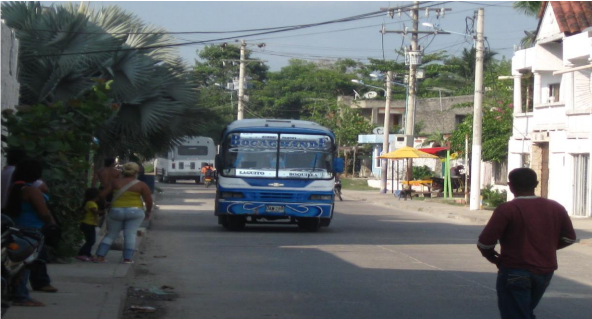
Calles de la Boquilla. Fotografía tomada en septiembre de 2012.