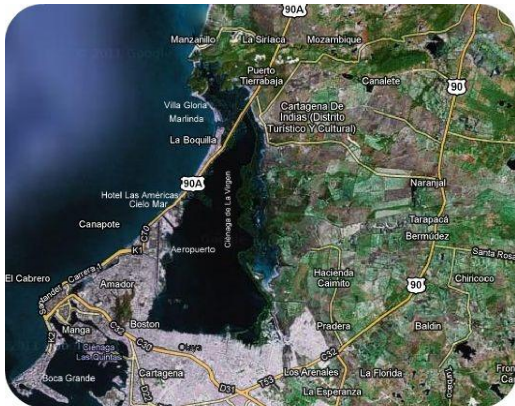
Mapa 2 Fotografía aérea de Cartagena centrado en la Ciénaga de La Virgen. Fuente: Google Earth. 2014

Poblamiento de La Boquilla, Marlinda y Villa Gloria: narraciones del pasado y “nuevas identidades étnicas”