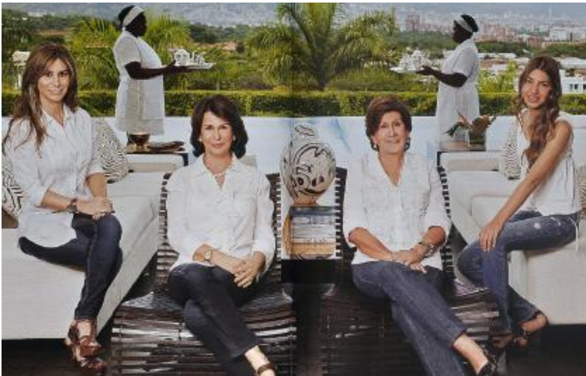
Imagen 7. La revista Hola Colombia publicó una historia sobre una familia prestante del departamento del Valle del Cauca y acompañó el artículo con esta foto. En el fondo aparecen las dos empleadas domésticas afrocolombianas de las mujeres blancas que protagonizaban el artículo.