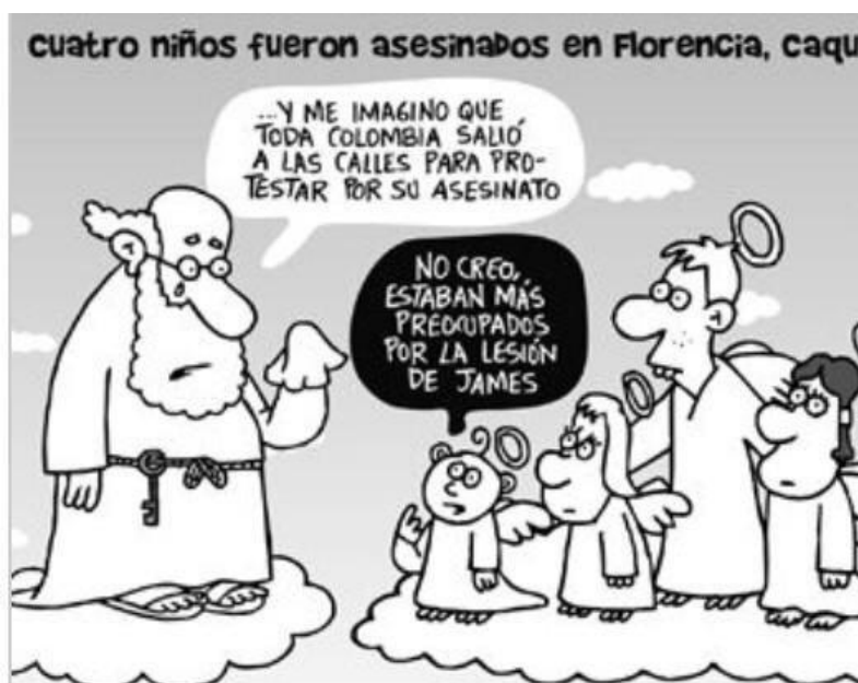
Imagen 5. En 2014 el caricaturista Matador publicó esta imagen en la que critica la forma en la que se priorizan las noticias en Colombia. El fútbol suele registrarse con mayor despliegue frente al resto de la información. La caricatura se titula "Noticia de segunda página".

presentador de Los Puros Criollos , este resultado muestra que el Reinado Nacional es más importante para los colombianos en términos de identificación que el Festival Iberoamericano de Teatro de Bogotá, La Feria del Libro de Bogotá, el Carnaval de Barranquilla y el Hay Festival . Desde comienzos del siglo XX han proliferado reinados con diferentes temáticas: reinas de los estudiantes, de los trabajadores, de productos agrícolas como la papa y la panela, de la tercera edad, de la ternura, de la comunidad LGBTI, y los recientemente cuestionados reinados de niñas como Niña Colombia y Mis Tanguita.