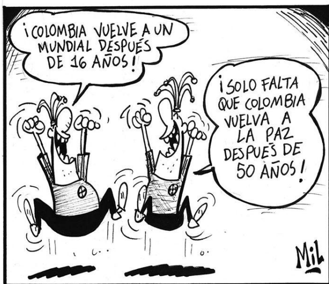
Imagen 4. Caricatura de Mil publicada en El Tiempo tras la clasificación de la selección de fútbol de Colombia al Mundial de Brasil 2015.

Pese a lo absurdo que pueda parecer que los colombianos digan ser felices cuando los encuestan, es posible que sea cierto que hay colombianos felices. El error está en asumir que solo es feliz quien no tiene problemas y vive en un mundo perfecto. Desde la economía, Jason Cruz y Julián Torres decidieron abordar la pregunta ¿De qué depende la satisfacción subjetiva de los colombianos? Aunque el interrogante sobre la felicidad suele hacerse con mayor frecuencia desde la psicología, este asunto también ha adquirido relevancia en economía, particularmente para que, quienes diseñan política económica, puedan “evaluar el efecto de las decisiones económicas y las condiciones institucionales sobre el grado de satisfacción de los individuos” (Cruz y Torres, 2006: 133).