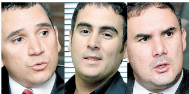
Imagen 6. (A) La obra de Transmilenio por la calle 26 en Bogotá presentó retrasos por cuenta del mal uso de los recursos públicos por parte de los hermanos Nule (B), quienes tenían a su cargo la obra. Los hermanos Nule lavaron recursos públicos.

Sin embargo, la más famosa de estas frases fue la pronunciada por el ex Presidente Julio César Turbay Ayala: “Hay que reducir la corrupción a sus justas proporciones”. 67 Si alguien, durante su campaña política, es decir, en el momento en el que debe ser más cauto en sus pronunciamientos, es capaz de expresar públicamente una interpretación tan 'particular' respecto a la corrupción es porque de cierto modo asume que va a haber receptividad, comprensión y/o aceptación