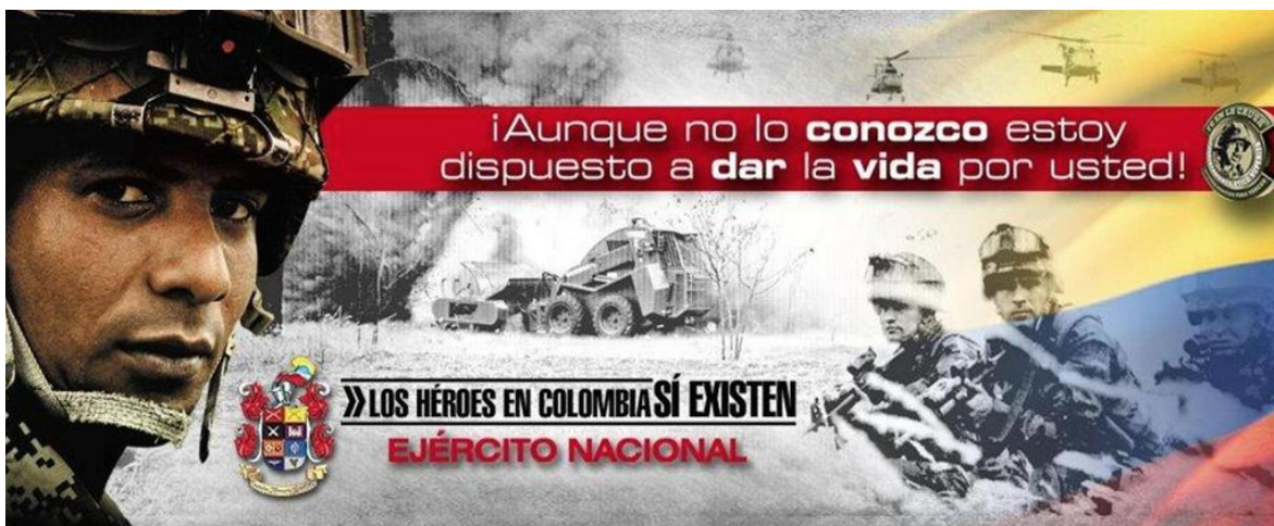
Imagen 2. Pieza de la campaña de Ejército Nacional de Colombia “Los héroes en Colombia sí existen”

más adeptos en el país. El incidente de la ‘silla vacía’ en la instalación de los diálogos del Caguán caló en la memoria de los colombianos. 36