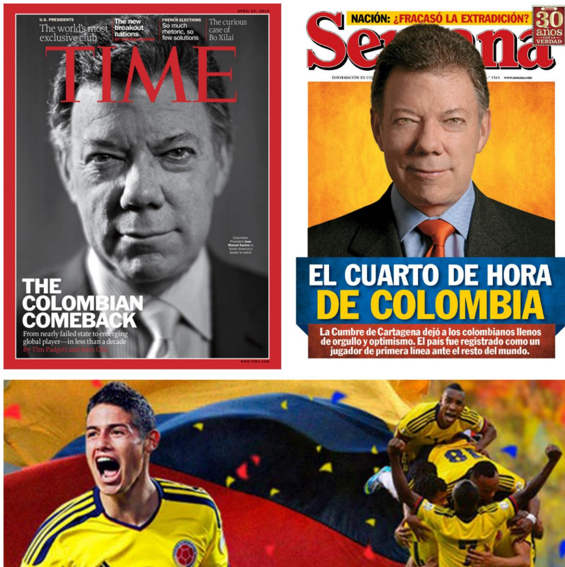
Imagen 3. A. Portada de la revista Time que señala la transición de Colombia de Estado fallido a jugador global emergente. B. Portada de la revista Semana tras la Cumbre de las Américas en 2012. C. Selección Colombia de mayores en 2014. La selección de fútbol es uno de los principales elementos relacionados con el orgullo patrio.

Siguiendo a Arias y Troller, se podría decir que aún el “ delirium trémens ” es uno de los males del país. Sin embargo, hoy existen nuevos referentes para expresar patriotismo más allá de esos pequeños triunfos ya trillados. Colombianos destacados internacionalmente en el deporte, la música, el arte y la ciencia hacen que la gente en Colombia se llene de ‘orgullo patrio’ y sienta como propios los triunfos de sus compatriotas.