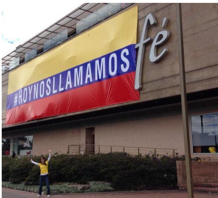
Imagen 8. Fachada del Centro Comercial Santafé ubicado en Bogotá el 28 de junio de 2014, fecha del juego entre Colombia y Brasil en el mundial de fútbol de Brasil 2014.

La pregunta que le hace la noruega al profesor de los Andes se conecta con uno de los objetivos de este capítulo. Tras haber hecho un recorrido por algunas de las representaciones de colombianidad más populares, y que al mismo tiempo, son algunas de las que más me cuestionan personalmente, quisiera proponer algunas conexiones entre esas representaciones y los sujetos que se han generado a partir de allí. Mi tesis es que esas representaciones de colombianidad producen unos sujetos particulares, que a su vez están relacionados con actividades y prácticas que han prosperado en Colombia, tales como el narcotráfico, la ilegalidad y el clientelismo.